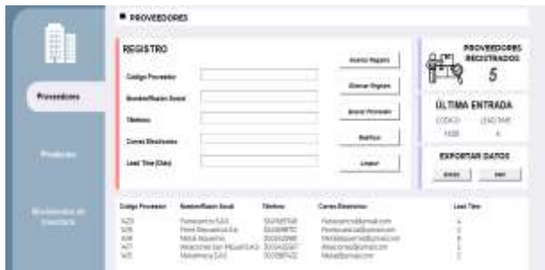
Figura 13: Actualización después de eliminar