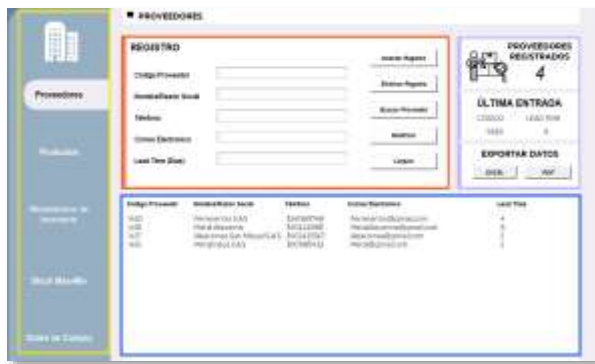
Figura 1: Interfaz proveedor

Antes de iniciar, es importante resaltar que el panel lateral izquierdo (marcado con un recuadro amarillo en la figura 1), corresponde al menú de navegación transversal presente en todas las interfaces.