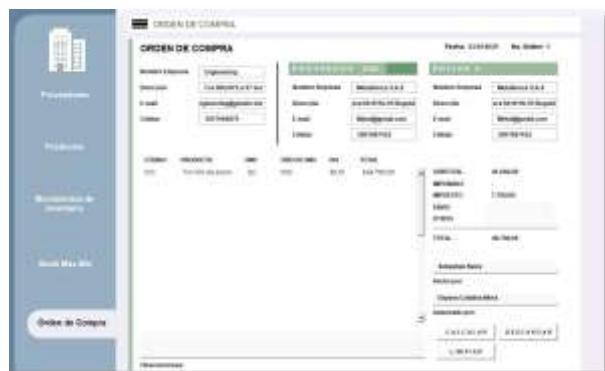
Figura 28: Interfaz de orden de compra

Como se mencionó previamente, el panel de “Datos de inventario” de la interfaz “Stock Max-Min” incluye el botón “Cargar a orden”, el cual transfiere automáticamente el producto y la cantidad necesaria a la interfaz de orden de compra, presentada en la figura 29.