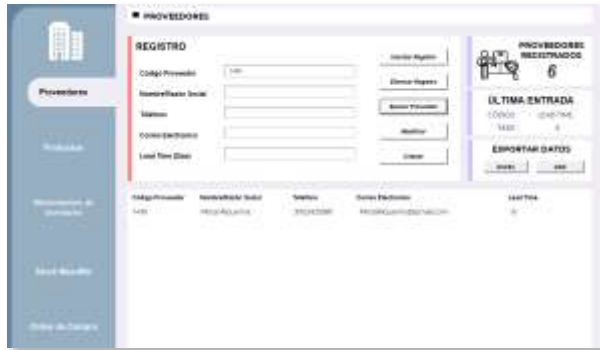
Figura 7: Segunda opción de búsqueda

lo cual, si existe una coincidencia, el registro aparecerá en la lista.