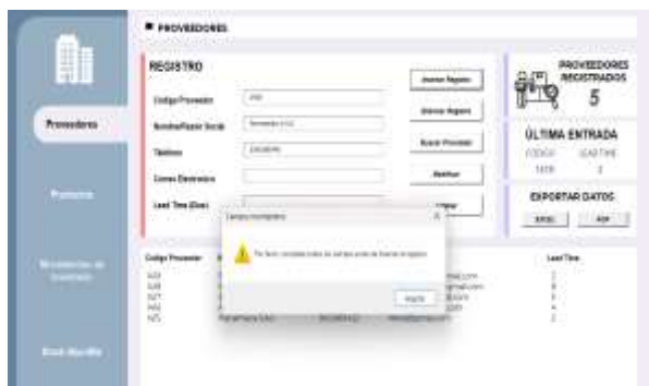
Figura 4: Validación de presencia de datos en todos los campos

Por otra parte, si el usuario intenta ingresar un proveedor al sistema dejando algún campo vacío, al presionar el botón “insertar registro”, se desplegará una advertencia indicando la obligatoriedad de completar todos los campos.