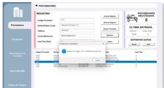
Figura 10: Modificación exitosa

En caso de confirmar la modificación, el sistema mostrará un mensaje de éxito.