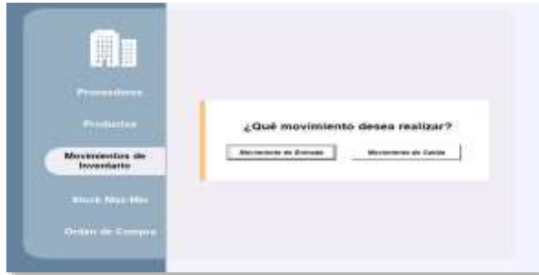
Figura 19: Interfaz de selección de movimiento