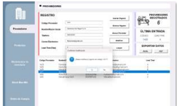
Figura 9: Solicitud de confirmación para modificar

"Modificar" aparecerá un cuadro de verificación de la acción.