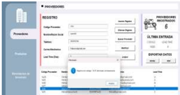
Figura 12: Registro eliminado con éxito

Cuando se confirma la intención de eliminar, aparece un cuadro de verificación de la acción, lo cual actualiza tanto la lista de registros como el total del indicador de proveedores registrados.