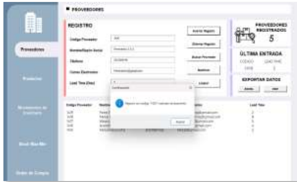
Figura 3: Registro exitoso de datos

Ahora, si se diligencian correctamente todos los campos, al dar clic en “insertar registro”, el sistema emitirá un mensaje confirmando la acción.