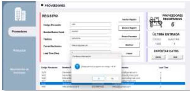
Figura 11: Solicitud de confirmación para eliminar