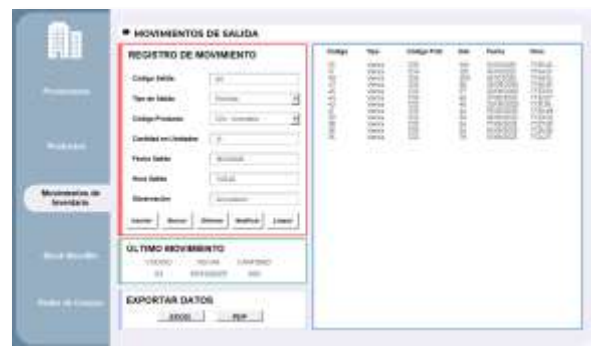
Figura 21: Interfaz de movimiento de salida

Finalmente, en la parte derecha de la interfaz (recuadro azul) se exhibe la lista de todos los registros de entrada ingresados al sistema.