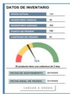
Figura 25: Panel de datos del inventario

Asimismo, en la parte inferior se cuenta con el botón “Cargar a orden”, el cual lleva los datos del producto y la cantidad de pedido a una orden de compra.