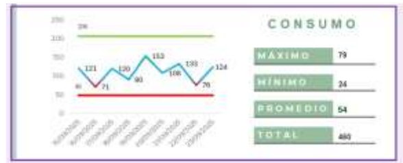
Figura 27: Panel de consumo

calculado como inventario anterior más entradas menos salidas. Por ello, la línea asciende con las entradas (picos verdes) y desciende con las salidas (picos rojos).