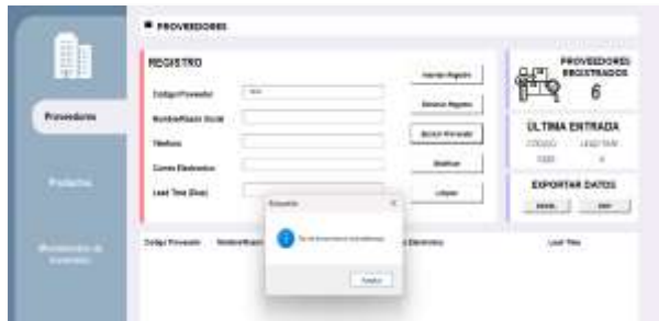
Figura 8: Mensaje de error por ausencia de registro

En caso contrario, si el proveedor no está registrado, se mostrará un mensaje de error indicando que no se encontraron coincidencias.