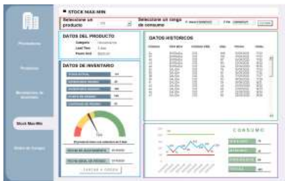
Figura 22: Interfaz de stock max-min

La siguiente interfaz constituye el elemento central del módulo, al ser responsable de proporcionar los cuatro indicadores, junto con datos de salida y alertas de reposición apartir de la información proporcionada por las tres bases de datos.