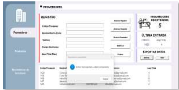
Figura 14: Botón exportar Excel

En cuanto al panel de exportación de datos, el usuario puede generar un archivo de Excel con la información mostrada en el listado de registros.