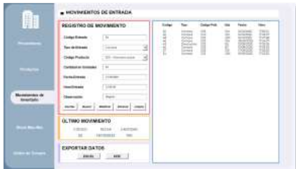
Figura 20: Interfaz de movimiento de entrada

En caso de elegir la opción de movimientos entrada, el usuario es direccionado a una interfaz compuesta por cuatro paneles, como se observa en la figura 21.