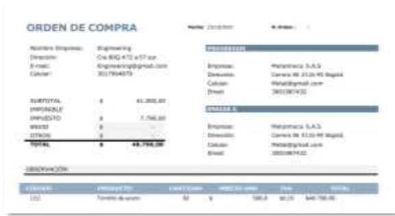
Figura 29: Documento PDF de O.C

calcular el total de la orden, otro limpia los campos y un tercero posibilita la descarga de la orden en formato PDF, facilitando así la gestión y formalización del proceso de compra.