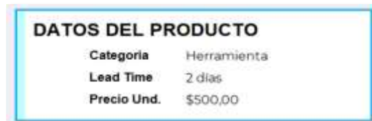
Figura 24: Panel de datos del producto

El siguiente panel corresponde a datos del producto, como se observa en la figura 25. Este se encarga de recuperar la información almacenada y mostrar los datos de categoría, lead time y precio, elementos que complementan el análisis y facilitan la identificación del producto.