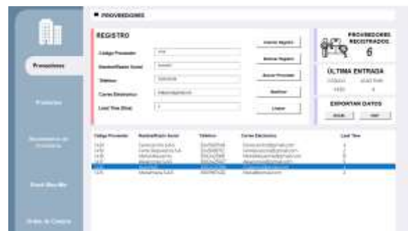
Figura 6: Primer opción de búsqueda

En cuanto al proceso de búsqueda de registros, el usuario cuenta con dos opciones. La primera consta de seleccionar directamente al proveedor desde la lista de registros, lo cual completara automáticamente todos los cuadros de texto.