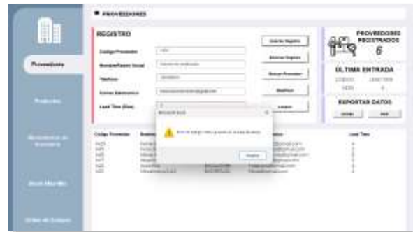
Figura 5: Advertencia de duplicidad de datos

Por otra parte, si el usuario intenta registrar un código que ya existe en el sistema, aparecerá un mensaje de advertencia.