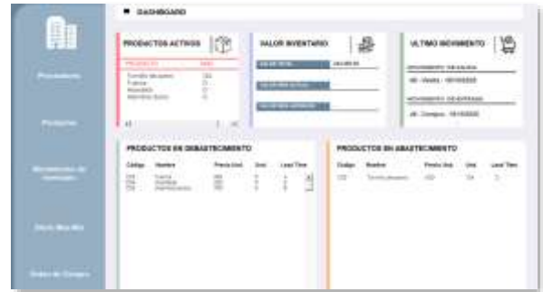
Figura 30: Interfaz de dashboard