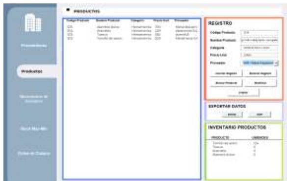
Figura 18: Interfaz productos

La segunda interfaz de base datos corresponde a productos, como se puede observar en la figura 19. Esta cuenta con una estructura similar al sistema de gestión de información de proveedores.