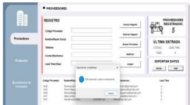
Figura 16: Documento PDF

Otra forma de obtener la información es mediante un archivo descargable de PDF.