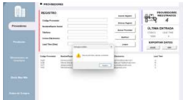
Figura 2: Restricción de ingreso de datos

Una vez se reconoce la disposición de los paneles en la interfaz, se procede a ejemplificar el funcionamiento de los botones CRUD. Respecto al proceso de registro de datos, se debe tener en cuenta que los campos de texto de código, teléfono y lead time del panel de registro solo permiten digitar valores numéricos debido a su naturaleza, bloqueando caracteres alfabéticos o símbolos y emitiendo un mensaje de alerta.