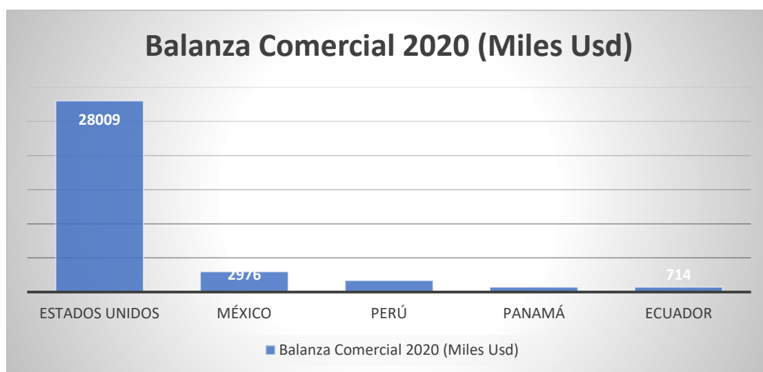
Figura 2. Elaboración propia, listado de importadores del producto exportado en Colombia (Trade Map, 2022).

En cuanto a las exportaciones del Sector Cuero a nivel global, en el periodo 2016-2020 cuenta con una tasa decrecimiento anual -36% a nivel mundial teniendo en cuenta que una de las variables que más afecto fue la disminución en la compra de materia prima para su producción en el cual los países en los cuales la balanza comercial en el año 2020 en miles de dólares que tuvieron pérdidas de saldo negativo -53,141, donde los cinco países a los que Colombia en la figura 2, se muestra que el país que más exportó, representando en miles de dólares, fue Estados Unidos USD 28,009, México USD 2,976 y Perú USD 1,689, Panamá USD 732, Ecuador USD 714, otra línea analizar es la cantidad exportada que se realizado en el periodo ya que tras las diferentes variables como la disminución en la compra de materia prima, el desbalance que hay más ingreso de mercancía de la que se exporta la participación comercial es: Estados Unidos 68,4% en este país podría destacar tras el tratado de libre comercio tienen puerta abierta a la actividad comercial sin muchas barreras, le sigue México con 7.3%, Perú 4.1%, Panamá 1.8%, Ecuador 1.7%, como se observa en la figura 3 (Trade Map, 2022)