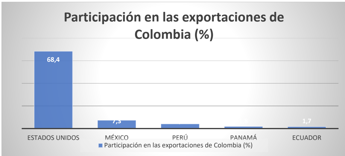
Figura 3. Elaboración propia, listado de importadores del producto exportado en Colombia (Trade Map, 2022).